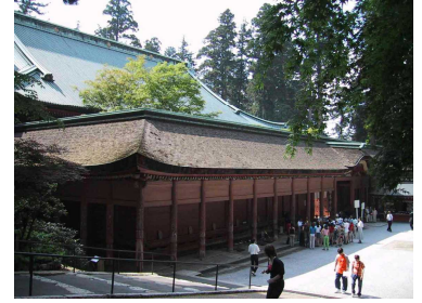
えんりやくじ ③ 延暦寺

(1) ①～③の寺院がつくられた時代の組合せとして、正しいものを、次のア～エから1つ選び、記号で答えなさい。