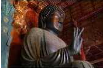
① 東大寺 大仏