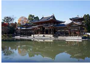
びようどういん ② 平等院