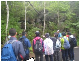
専門のガイドの方に説明を受けながら調査を行った。

然別湖畔の山では「がれ場」とよばれる岩塊（がんかい）斜面が多数みられます。その奥底には日本一古いとされる永久凍土があり、夏場でも冷気を出しています。私たちはこの「風穴」を調査し、調査結果は、パンフレットにまとめることとしました。