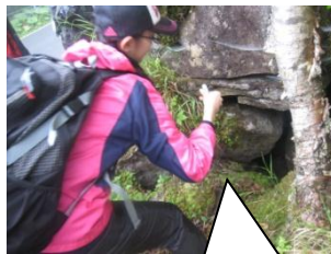
風穴では内外の温度や風速を測定して記録した。