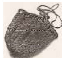
【サラニワ】 しなの木の皮で編んだ 背負い袋

アイヌ民族の方を講師に、アイヌの人たちの代表的な楽器である「ムックリ」の製作と演奏の指導をいただくとともに、アイヌ文様や古式舞踊についても説明していただきます。