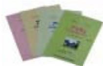
<平成19年度アイヌ語ラジオ講座テキスト(vol.1~4)>

現在では、主要な第二外国語を学ぶより厳しい学習環境と言えます。話し手はすべて日本語とのバイリンガルですが、近年、アイヌ語を取りまく環境が改善されつつあり、各地でアイヌ語を継承・復興させるための事業が行われています。1970年代になると、ウタリ協会が中心となりアイヌ語教室(現在全道14校)が開かれて、1994年には、アイヌ語教室共通テキストとして『アコロ イタク』が刊行されました。アイヌ文化振興法制定後、アイヌ語の弁論大会、アイヌ語ラジオ講座が放送されるなど、様々な活動が行われてきています。