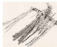
【ノヤイモシ】 よもぎで作った守護神

博物館学芸員を講師に、アイヌの人たちの伝統的な生活文化について、実際の生活用具や様々な儀式を紹介してもらいながら、説明していただきます。